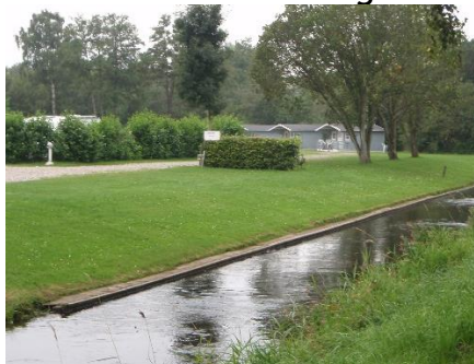
Starten i Tørring