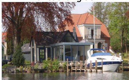
Luksus lang åen