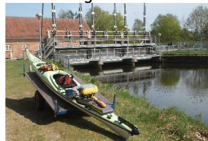
Vi kommer ikke udenom...