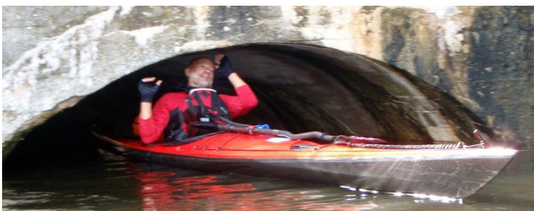
Passagen ind til kanalen til Vestbirk Kraftværk...

Her indhenter vi de andre kajaker. Det er Fynboere, som var startet fra Vestbirk Camping. De roede turkajakker uden bagage, hvilket forklarede, at de kunne "forsvinde" så hurtigt. De var lidt pivsede, fordi passagen under vejen var lang, mørk, klam og meget lav. De havde sendt en mand igennem og afventede hans klarsignal, før de selv skulle "nyde noget".