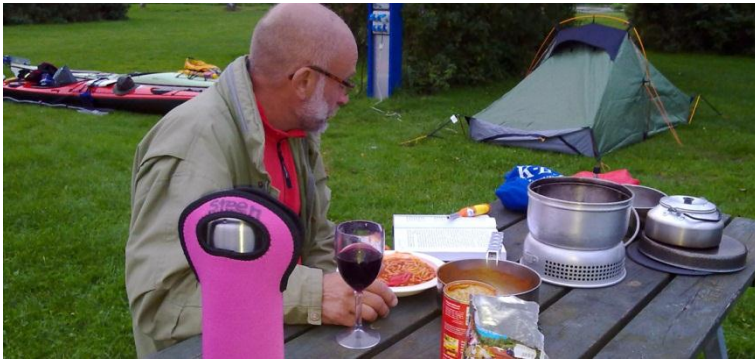
Aftensmad første stop. Rødvind, spaghetti og en god bog!

Ved landgang på første etape, Gudenåens Camping, har vi begge "en mindre botanisk have" på bagdækket – inklusive brændenælder! Vi slår lejr kun 75 meter fra åen.